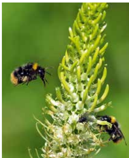
Der lange Rüssel mancher Arten hilft beim Nektartrinken.

nicht erfolgreich vermehren. Beide Arten sind dann bedroht. Und mit einer Pflanzenart verschwinden zehn Tierarten – so eine Faustregel von Biologen. Einsiedlerbienen entfernen sich z.B. nur 70 bis 500 Meter von ihrem Nest. In diesem kleinen Umkreis müssen sie ihre „Futterpflanze“ und geeignete Nistmöglichkeiten für ihre Brut und die Überwinterung finden. Der Aktionsradius der