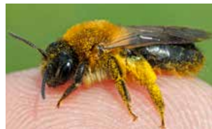
Eine Sandbiene mit Blütenstaub im Fell.

Weltweit ist etwa die Hälfte aller Wildbienenarten vom Aussterben bedroht. Die Honigbienen werden zudem von Schädlingen bedroht (z.B. Varroa-Milbe). Heutzutage mangelt es an einem vielfältigen Angebot an Nistplätzen und nährhaften Blüten, insbesondere wenn im Frühsommer die Kulturpflanzen auf den Feldern und in den Plantagen verblüht sind. In Gärten und Parks wachsen oft exotische Zierpflanzen, mit denen die Bienen nichts anfangen können. Lebensräume werden knapp, weil Flächen versiegelt und zersiedelt werden. Manchmal hört man von Pflanzenschutzmitteln, die Bienen schädigen können. Bienenenschutz muss also an vielen Stellen ansetzen und jede(r) kann etwas beitragen.