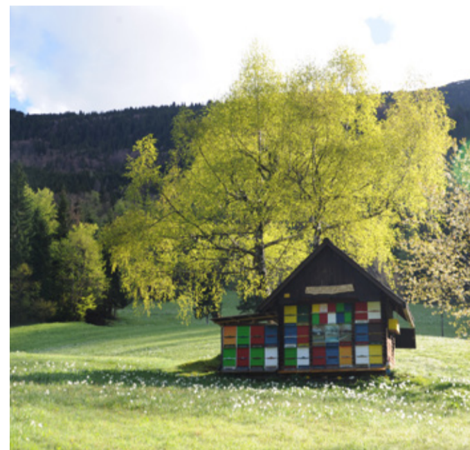
Bienenstock unterhalb vom Berg Golica, 2010

Keine Anmeldung erforderlich / Ort: Garten MEK