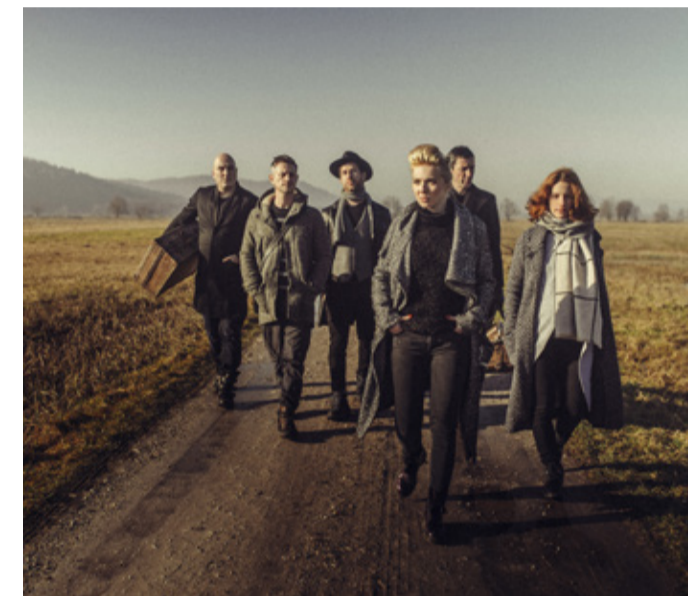
Die slowenische Band Katalena

Keine Anmeldung erforderlich / Eintritt frei / Ort: Garten MEK