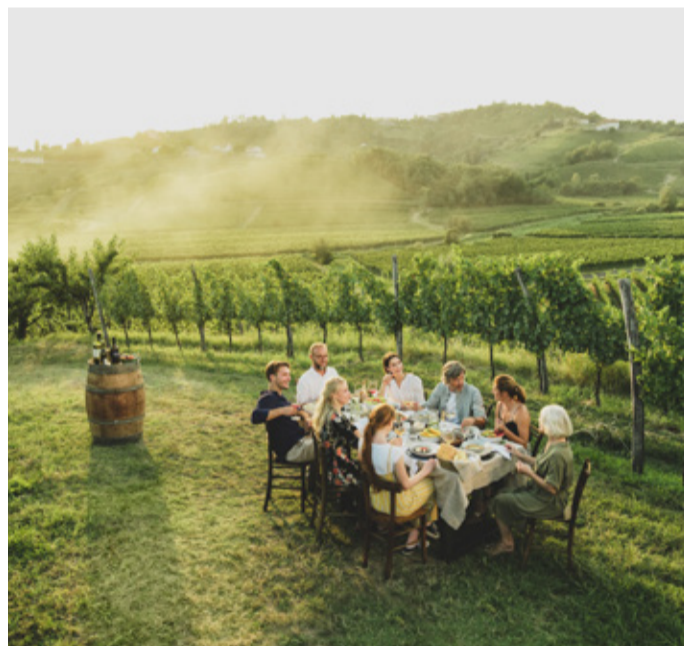
So schmeckt Slowenien

STO SLOVENIAN BOOK AGENTS I FEEL SLOVENIA