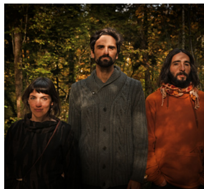
Die Band ŠIROM

60 Min / 100 € pro Gruppe (25 Personen) zzgl. Eintritt